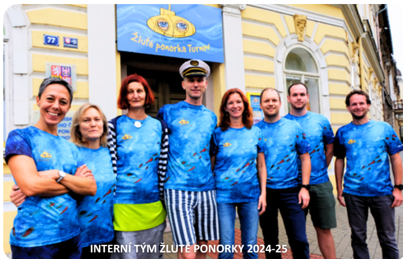
INTERNÍ TÝM ŽLUTÉ PONORKY 2024-25