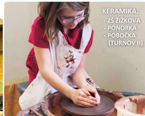
KERAMIKA: - ZŠ ŽIŽKOVA - PONORKA - POBOČKA (TURNOV II)