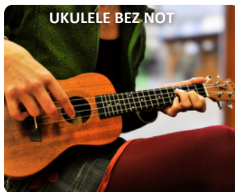
UKULELE BEZ NOT

Práce s mladými vedoucími tzv. Plavčíky se rozvíjela především díky kurzům her v Ponorce.